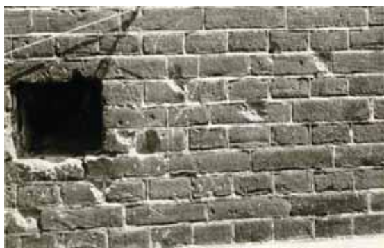
De muur voor plaatsing van het monument. De gaten van de kogels zijn nog te zien