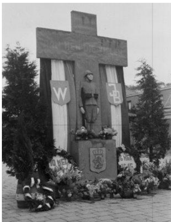
Het monument op het plein voor de Sint Jozefschool aan het Achterom

zitter van de Oranje Vereeniging. Eindbestemming is het plein van de Sint Jozefschool aan het Achterom voor de onthulling van een monument. Uit de krantenkolommen van toen: 'De stoet was tot een menschenmenigte aangegroeid toen ze op het Achterom kwam om aanwezig te zijn bij de onthulling van het monument voor de gevallen. Dit monument, geplaatst door de buurtvereniging Achterom, werd vervaardigd door de fa. Vogelpoel. Na opstelling van een afdeeling B.S., onder com-