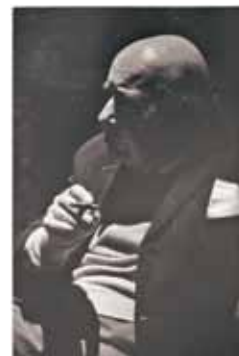
Albert van Dalsum leest tijdens een herdenking het gedicht 'Celdroom' van H.M. van Randwijk voor.