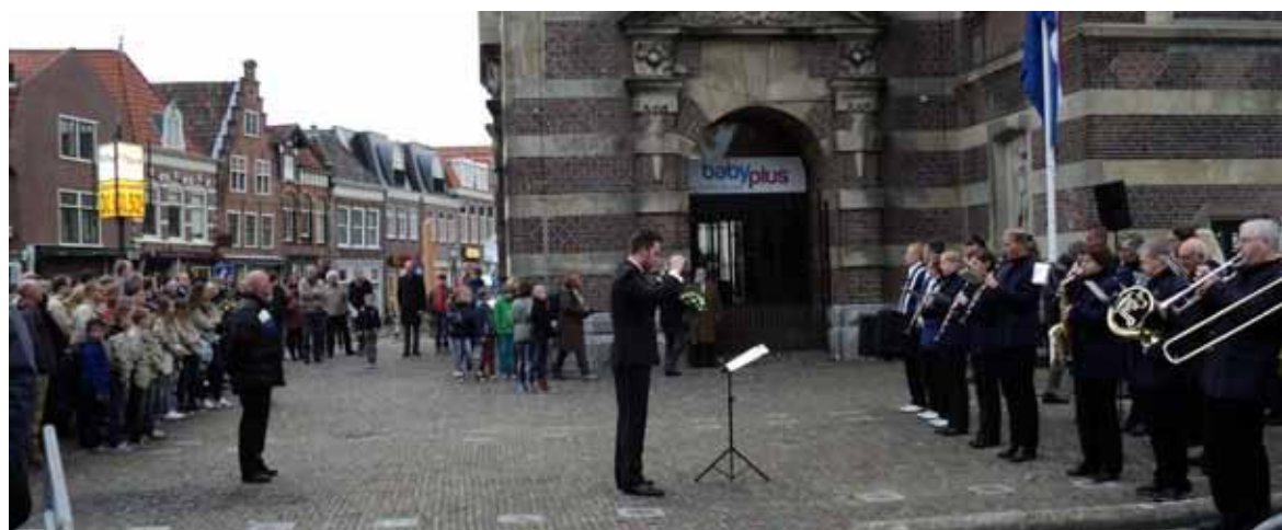
Beeld van de herdenking op het Kerkplein in 2014