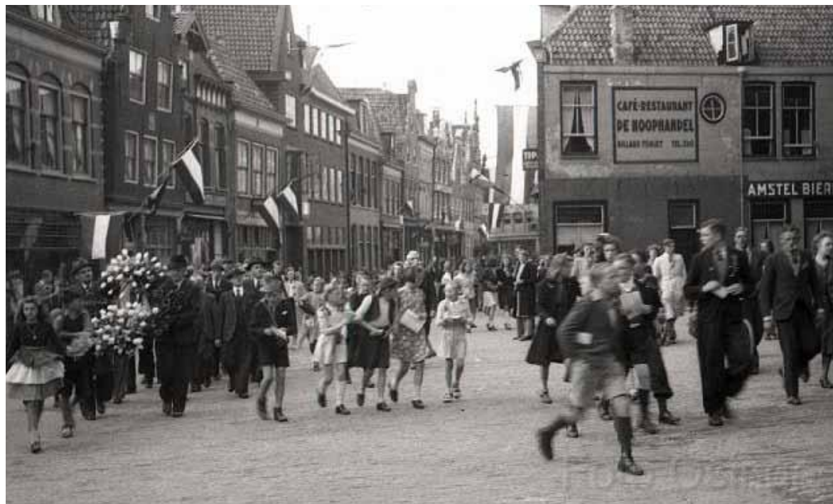
De Stille Tocht bereikte in 1946 vanuit de Nieuwstraat het Kerkplein

Een traag lopende muzikant met omfloerste trom, een wijkagent met witte handschoenen, een heel stel jongens en meisjes met bloemen in de hand, de eerste burger met ambtsketen, een bestuurslid met ondersteunende wandelstok van het comité dat de traditie van Hoorns Stille Tocht in ere houdt. Samen vormen zij tegenwoordig de kop van de lange sliert mensen die elk jaar op 4 mei van de Westerdijk naar het Kerkplein kronkelt. Om daar te gedenken, twee minuten stil te zijn, bloemen neer te leggen en respect te betuigen aan de slachtoffers uit met name de Tweede Wereldoorlog. Maar ook uit al die andere oorlogen waarbij na 1945 Nederlanders betrokken zijn geweest.