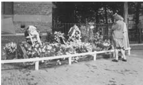
Een van de eerste herdenkingen. Het monument aan de kerkmuur moet nog worden aangebracht

op 10 mei 1940 al sneuvelde. De herdenking is op de Kaasmarkt, waar de gezagstroepen van de 4e Compagnie district Hoorn het geweer presenteren. Op de Kaasmarkt ook veel oud-militairen die overal in Nederland de bewogen meidagen van 1940 hebben meegemaakt. Velen hebben het oude uniform van toen aangetrokken. De aanwezigen zijn het na afloop al snel eens: het is een bewogen bijeenkomst.