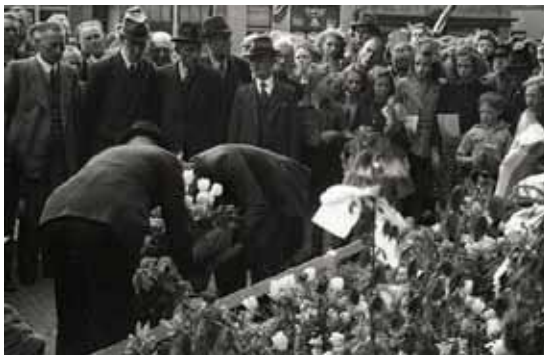
Nog altijd maakt de kranslegging deel uit van de Stille Tocht