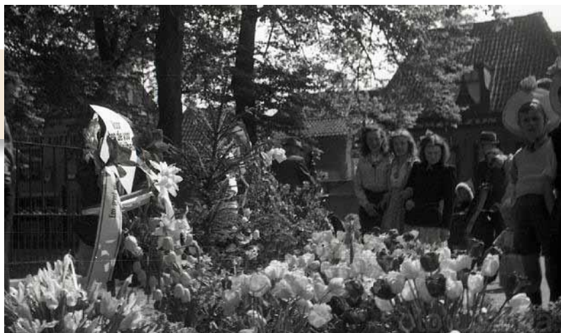
Na de kranslegging in 1946. In stilte wordt de bloemenzee bekeken. De tekst op de krans link: 'Voor hen die voor Onze Vrijheid vielen'